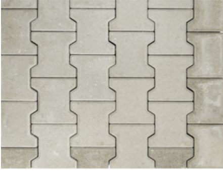
Doppel-T Verbundstein grau 8 cm Verlegung im Läuferverband mit Halbstein und Anfänger