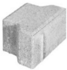
Halbstein 10 x 16,5 x 8