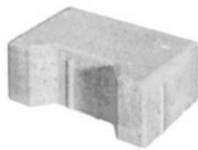
Anfänger 20 x 14 x 8