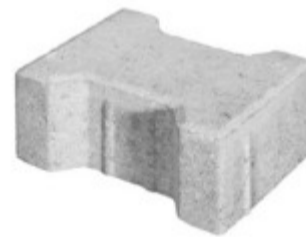
Normalstein 20 x 16,5 x 8