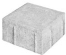
Rinnenplatte 16 x 16 x 8