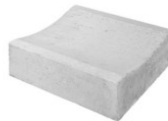
Muldenstein 50 x 50 x 15