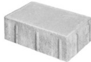
Rinnenplatte 24 x 16 x 8