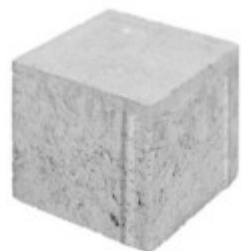
Pflasterstein ohne Fase 16 x 16 x 14