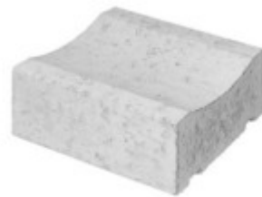
Muldenstein 30 x 30 x 12