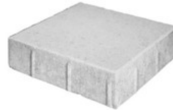
Rinnenplatte 30 x 30 x 8